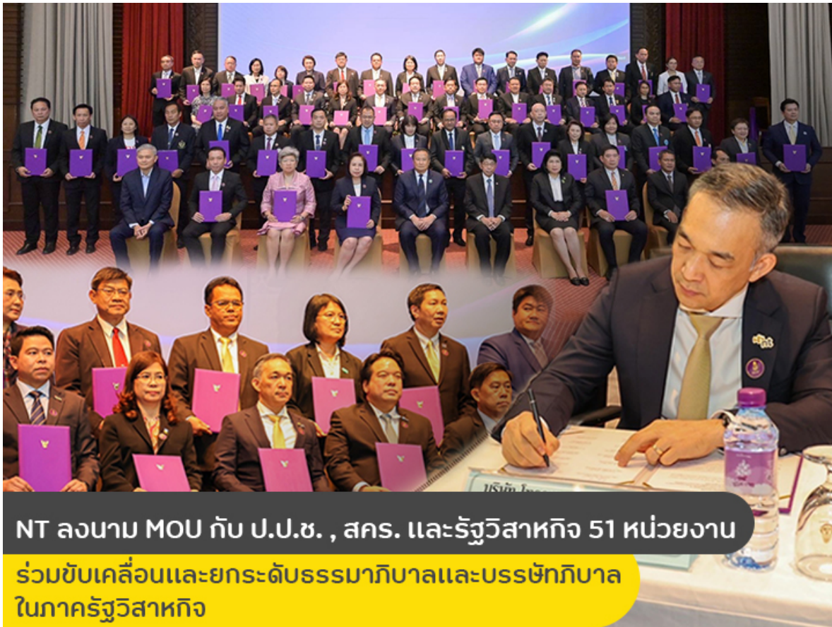
NT ลงนาม MOU กับ ป.ป.ช. , สคร. และรัฐวิสาหกิจ 51 หน่วยงาน

ร่วมขับเคลื่อนและยกระดับธรรมาภิบาลและบรรษัทภิบาล ในภาครัฐวิสาหกิจ